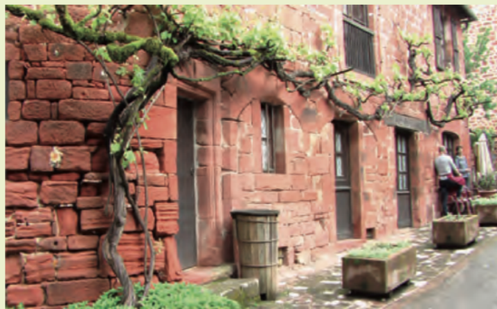
machen gemeinsame Urlaubstouren