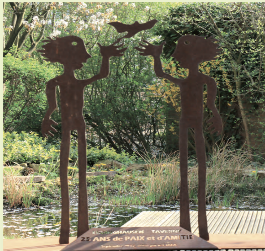
Lüdinghausen Taverny 25 ANS de PAIX et d'AMITIÉ