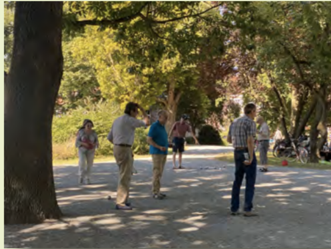
spielen Boule im Parc de Taverny