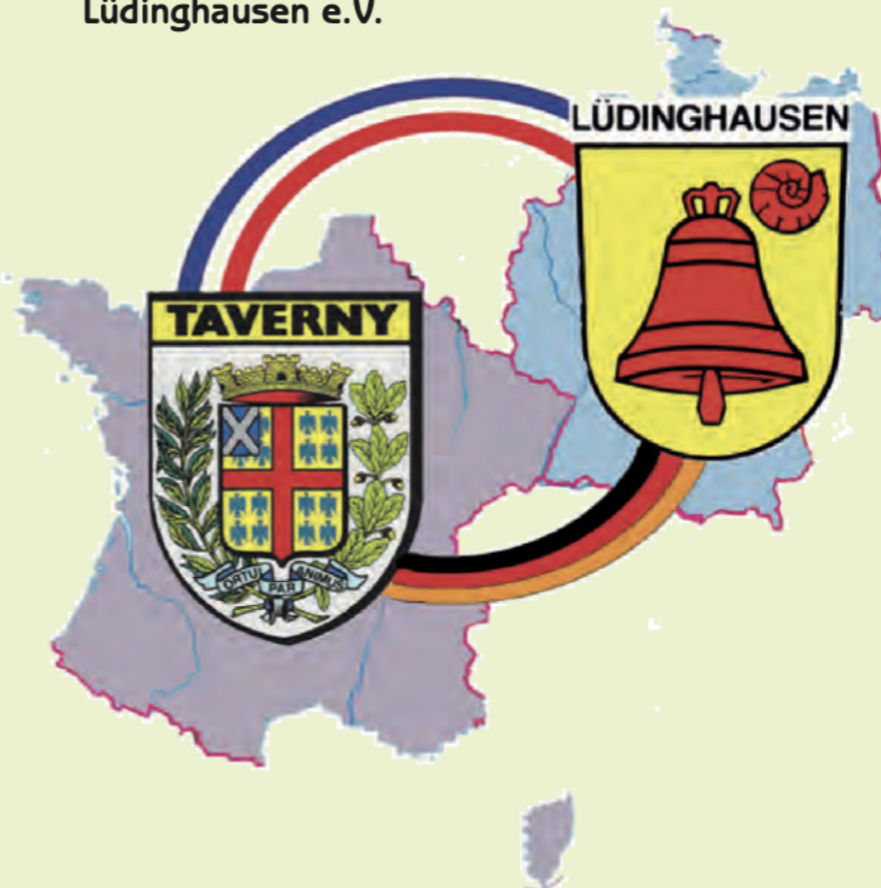
Comité de Jumelage et d'Amitié Franco-Allemand de Taverny

Deutsch-Französische Gesellschaft Lüdinghausen e.V.