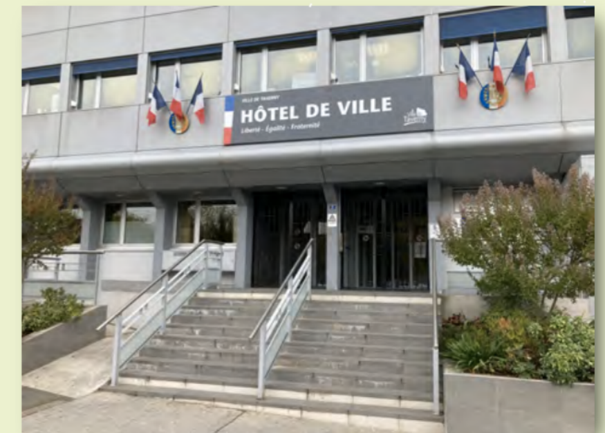
Rathaus der Stadt Taverny